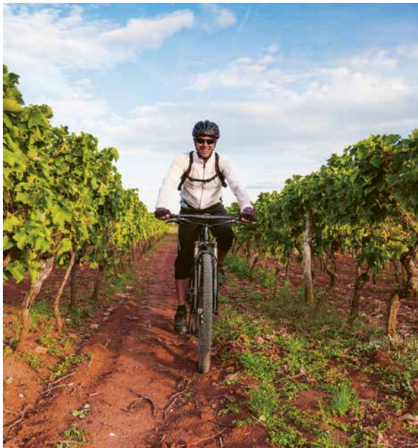
E-BIKE-TOUR DURCH DIE REGION CHARDONNAY

Verbringen Sie einen unvergesslichen Tag in Mâcon. Es stehen Ihnen zahlreiche RIVERSIDE CHOICE zur Auswahl, darunter eine E-Bike-Tour durch die Region Chardonnay mit einer Wein-