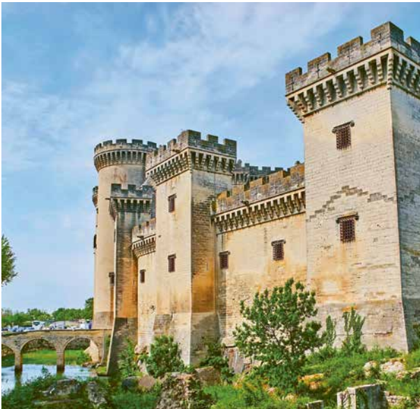
BURG VON TARASCON