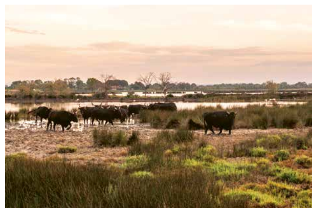
CAMARGUE-RINDER IM RHÔNE-DELTA

Der heutige Tag in Tain-l'Hermitage wird im wahrsten Sinne des Wortes genussvoll. Unsere RIVERSIDE CHOICE stellen Sie vor die Wahl: Genießen Sie eine Weinprobe im mittelalterlichen Schloss Tournon – oder kosten Sie feinste französische Schokolade bei Valrhona und erfahren Sie, wie wunderbar Wein und Schokolade miteinander harmonieren. Der Nachmittag eignet sich ideal, um sich mit einer Massage oder einer Wellnessbehandlung zu verwöhnen, während die Riverside Ravel weiter nach Lyon fährt.