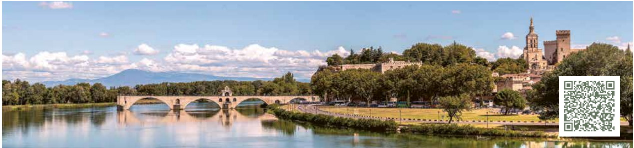
BRÜCKE SAINT-BÉNÉZET, AVIGNON

Ein Schiff, zwei Flüsse, unzählige Erinnerungen: Ihre 11-tägige Kreuzfahrt auf Rhône und Saône beginnt in der Provence, mit den imposanten Welterbe-Stätten von Avignon. Weiter geht es nach Arles, dessen malerische Motive schon Van Gogh begeisterte, und nach Viviers, ein mittelalterliches Juwel. In Lyon treffen sich Rhône und Saône. Die Stadt ist bekannt für 2000 Jahre Geschichte und eine erstklassige Gourmet-Szene. Entdecken Sie charmante Städtchen im Burgund, bevor die Riverside Ravel Sie wieder nach Lyon bringt. Très magnifique: die abendliche Fahrt durch das Rhône-Delta mit unserem AI Fresco Dinner auf dem Vista Deck.