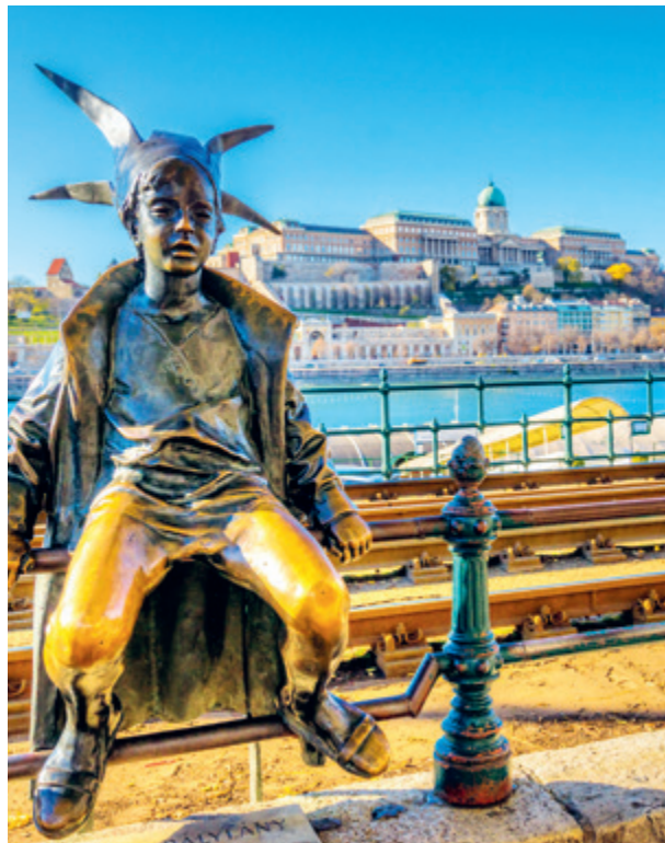
DIE KLEINE PRINZESSIN, BUDAPEST

Budapest braucht Zeit, um sein ganzes Flair zu entfalten. Gönnen Sie sich einen zweiten Tag, um die prachtvolle Stadt intensiv zu erleben. Entdecken Sie Schloss Gödöllő, einst Lieblingsresidenz von Kaiserin „Sisi“, oder die malerische Fischerbastei im Burgviertel. Zum Abschied gleitet die Riverside Debussy mit einem Glas Champagner vorbei an Budapests funkelnder Silhouette.