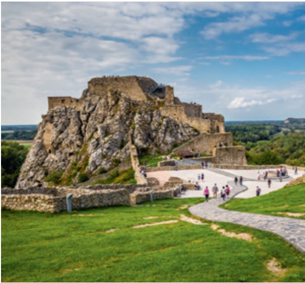
RUINE VON BURG DEVIN