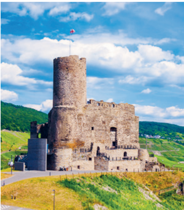
BURG LANDSHUT, BERNKASTEL

Ein herzliches „Bonjour“ erwartet Sie in der zauberhaften Stadt Straßburg, die mit ihrem unvergleichlichen Charme begeistert. Erkunden Sie die Altstadt und die beeindruckende Kathedrale oder tauchen Sie ein in die Geschichte bei einem Besuch des mittelalterlichen Dorfes Obernai!